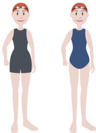
Figura 2 – Equipamentos de competição para as nadadoras infantis.