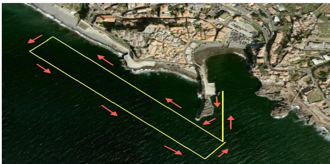
Provas 1500m (1 volta) e 3000m (2 voltas)