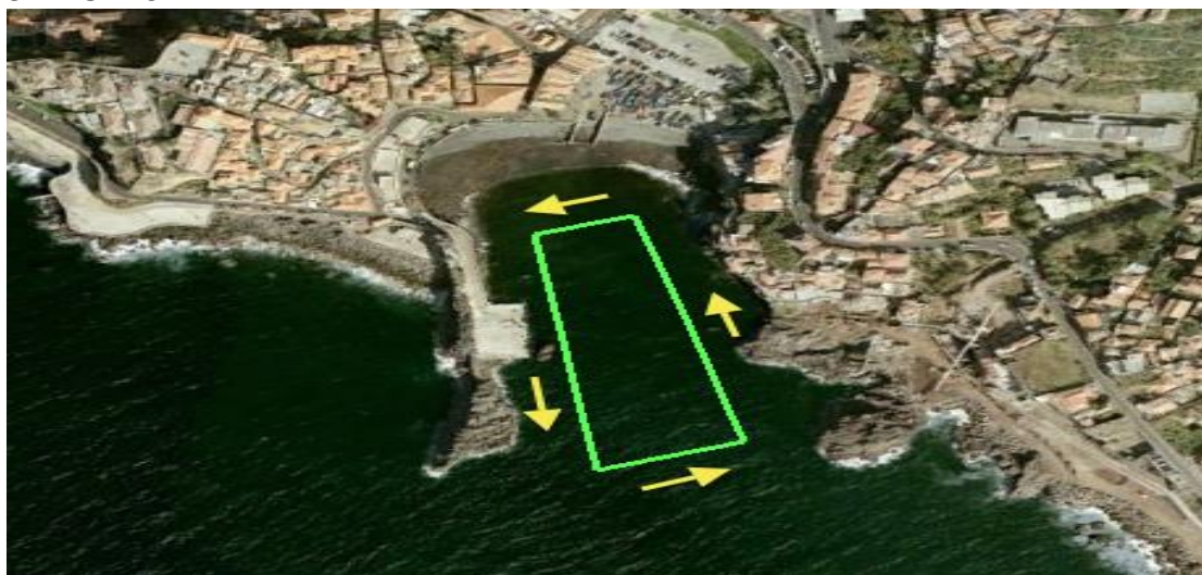
Prova 500m (1 volta)