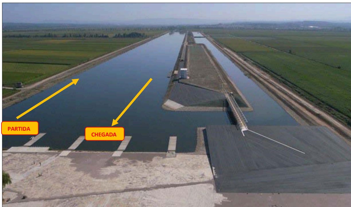
Imagem.2 – Zonas de Partida e Chegada